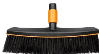
Szczotka do czyszczenia chodnika QuikFit™ ok. 60 zł