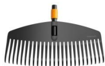
Grabie do liści z tworzywa QuikFit™ ok. 54 zł