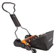
Kosiarka bębnowa StaySharp™ Max ok. 1220 zł